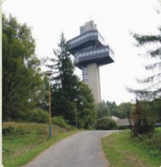
6 | Vyhliadková veža (54 km)