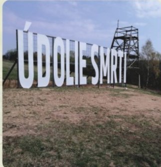
3 | Údolie smrti (41 km)