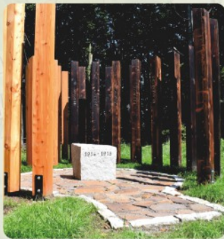
1 | Veľkrop (62 km)