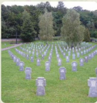
5 | Vojnový cintorín Hunkovce (45 km)