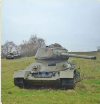
7 | Kapišová (40 km)