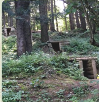
11 | Zemľanky (53 km)