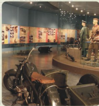
9 | Múzeum Svidník (35 km)