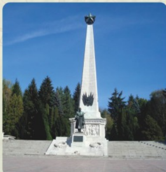
4 | Pamätník sovietskej armády (35 km)