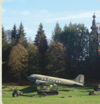
10 | Expozícia ťažkej techniky (35 km)