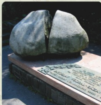
12 | Pomník generála Sázvského (54 km)