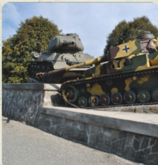
8 | Symbol tankových bojov (38 km)