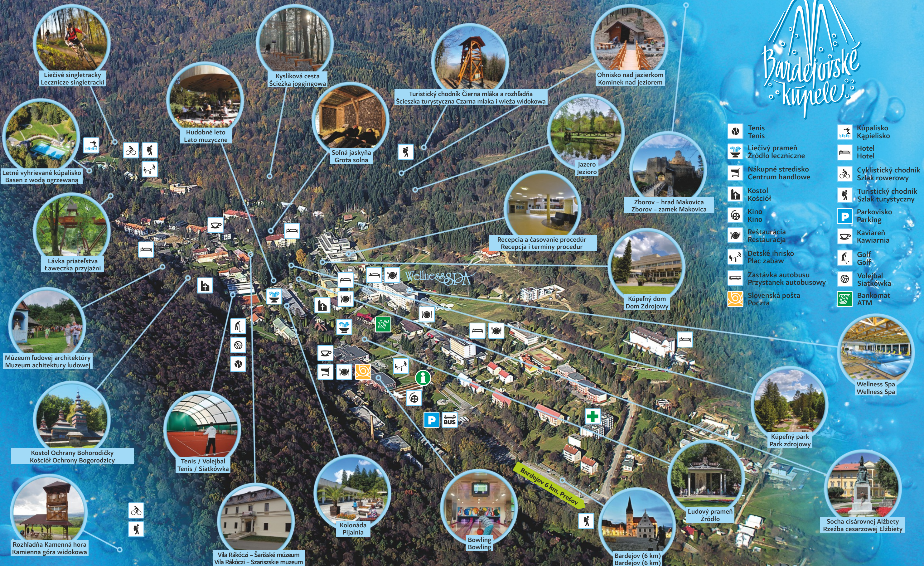
Liečivé singletracky Lecznicze singletracki